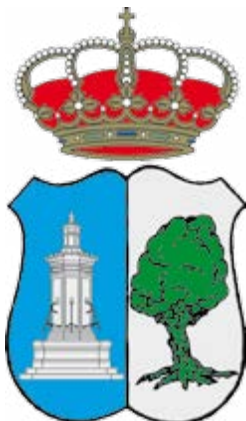
Ajuntament de la Font de la Figuera