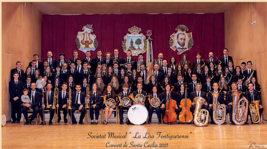
Societat Musical "La Lira Fontiguerense" Concert de Santa Cecília 2015