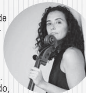
M a -

Des 2006 fins a 2008 pertany al claustre de professors del Conservatori Municipal de Ribeira. El 2008 comença la seua formació del Mètode Suzuki a Madrid amb A. López, i posteriorment a Lió amb R. Ribera i C. Latil, on finalitza la formació el 2014. Des d'aleshores ençà forma, al Col·legi Alemany de València, el grup Chiquichelos amb aquest mètode. Ha estat professora d'Utem Escola de Música i, actualment, a Cordes Espai Educatiu.